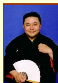
たうばなの えんまん 橋圓満