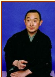
かつら こぶんじ 桂小文治