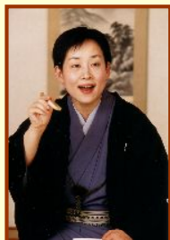
かつら うだんじ 桂右團治