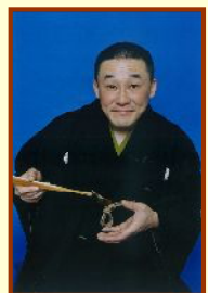
かつら おふく 桂お福