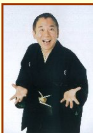
さんゆうていゆうしゅく 三遊亭遊雀